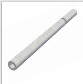
FBA - Spreize - 22