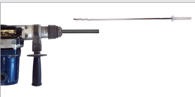
Bohrhammer mit Adapter und Luftschtanker