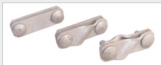
Typ BS-Doppel, verschiedene Ausführungen

Für die elektrisch leitende, lagesichere Verbindung von Flach- und Runderdern, Schraube M10