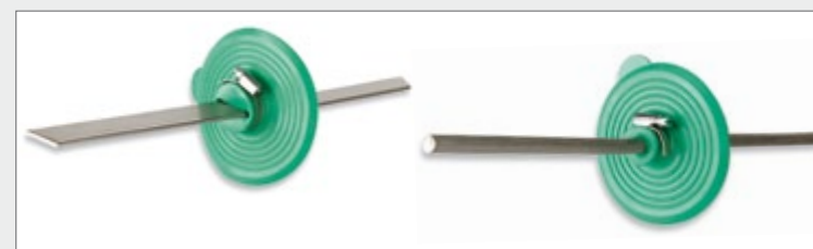
BS - MK für Flachleiter und für Rundleiter