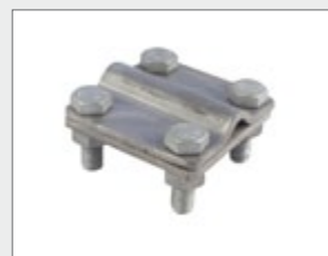
BS-Kreuz-verz., rund/flach Fundamenterder | 2

Für die elektrisch leitende, lagesichere Verbindung von Fundament- und Ringerdern mit verschiedenen Querschnitten