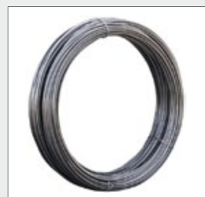
Lieferform: Rolle mit ca. 10 m oder 80 m, Material A4 auch als Einzelstäbe mit 1, 2 oder 3 m