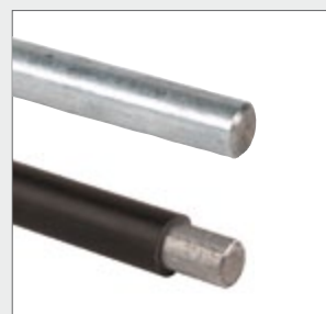
Blitzschutz rund Typ BS-Ø 10 mm; Material A4, verzinkt oder PVC ummantelt