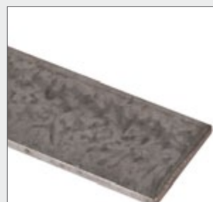
Blitzschutz flach Typ BS-FI 30 mm; Material A4, verzinkt

Zum Herstellen von Erdungsanlagen, Standardausführung Flachleiter 30 x 3,5 mm, Rundleiter Ø 10 mm, feuerverzinkt und A4