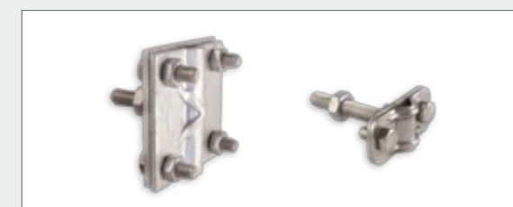
BS-Kreuz, rund/flach für 40 mm (verzinkt) und 30 mm (A4)