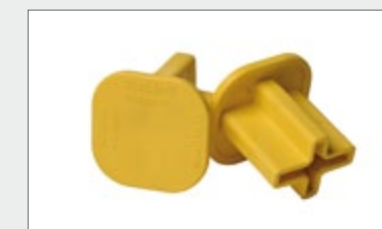
BS - MultiCap