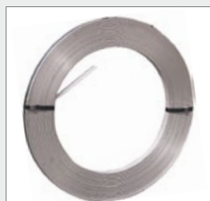
Lieferform: Rolle mit ca. 30 oder 60 m