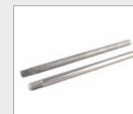
BS-Achse A4 oder verzinkt