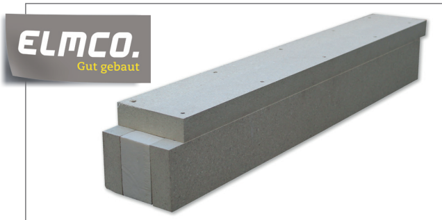
Schwellendämmelement ELMCO – SDE